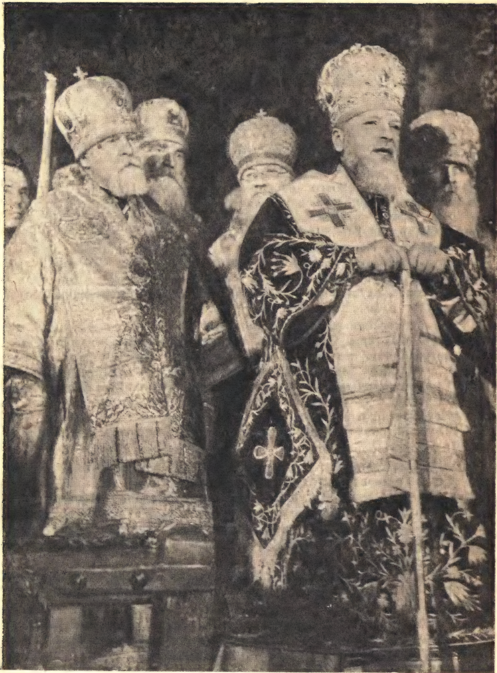
Святейший Патриарх Алексий произносит речь в Патриаршем Богоявленском Соборе перед молебном в день своей интронизации